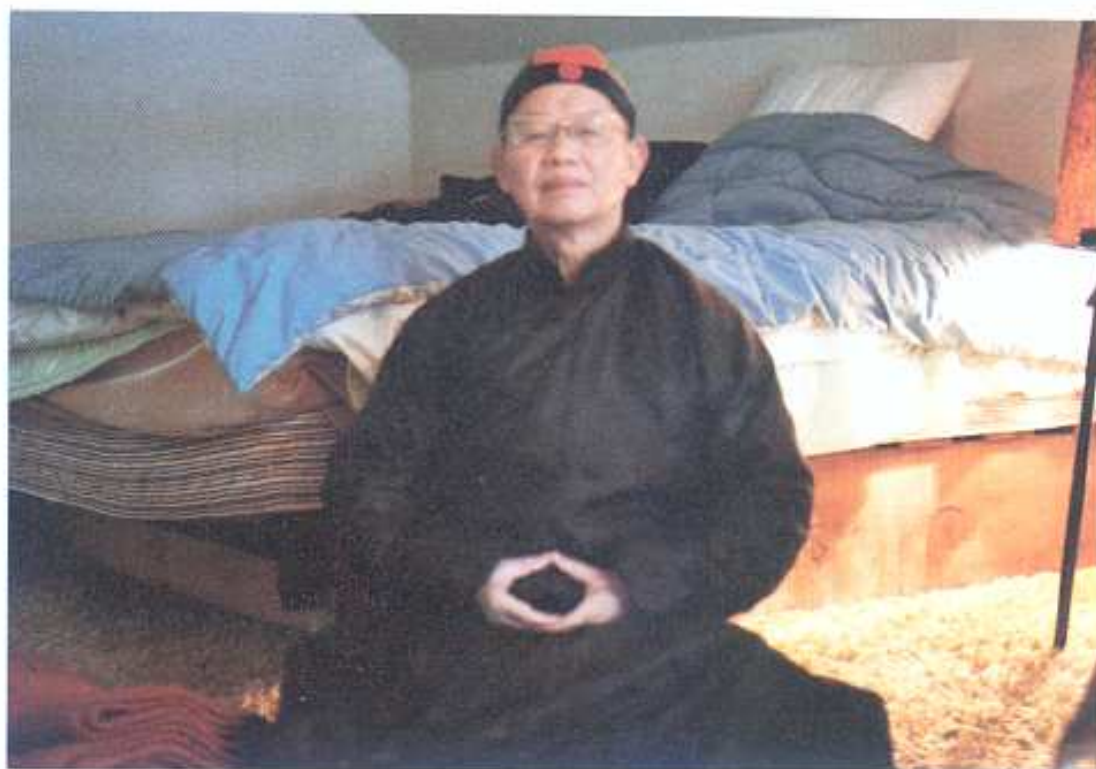
陳老居士法界大定