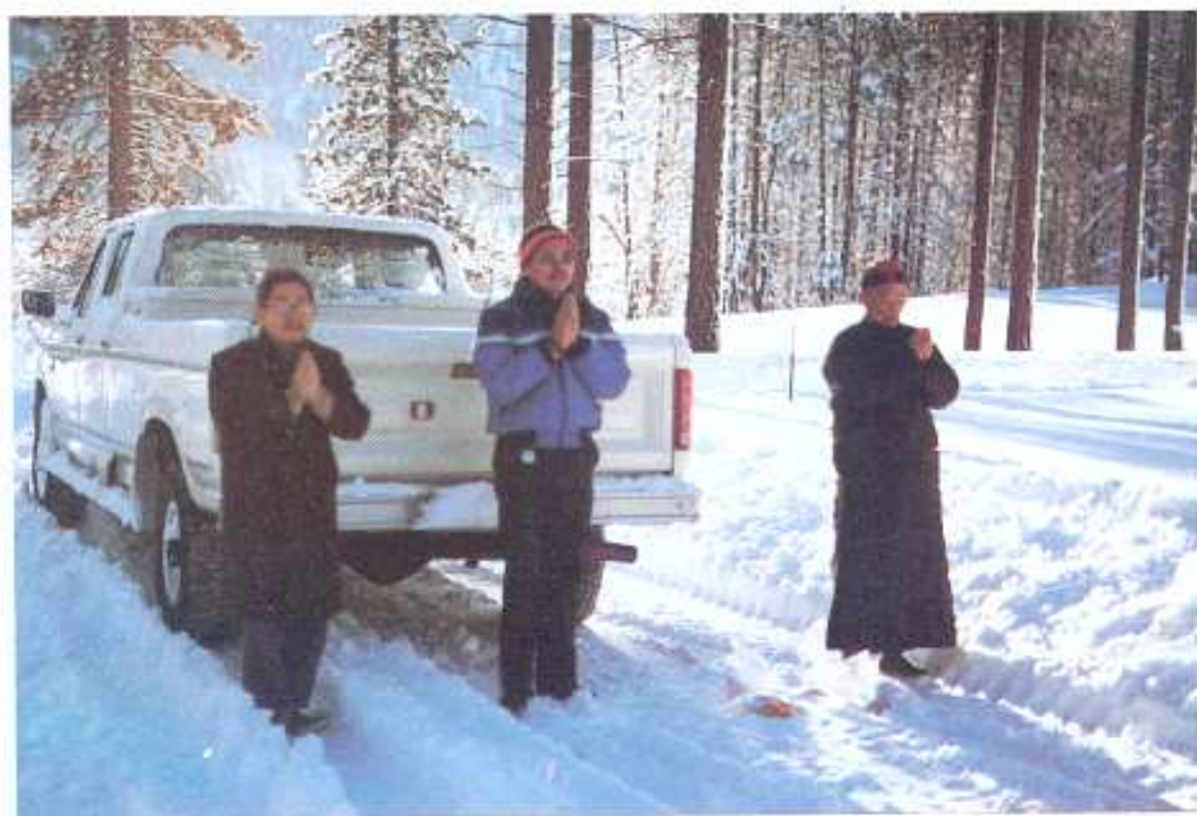
太浩湖畔公墳超幽