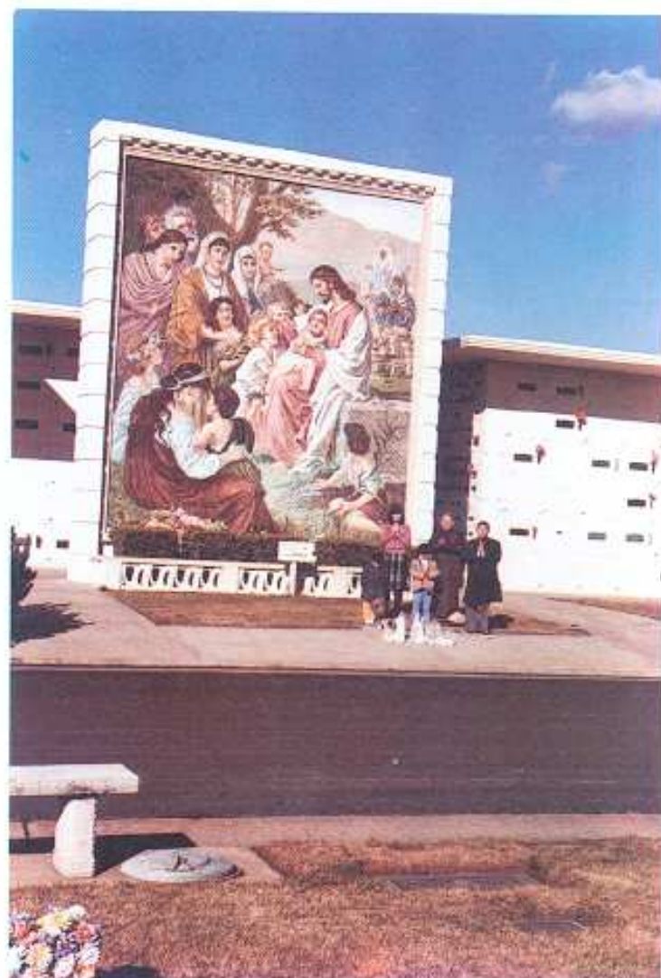
加州首府郊區公墳超幽