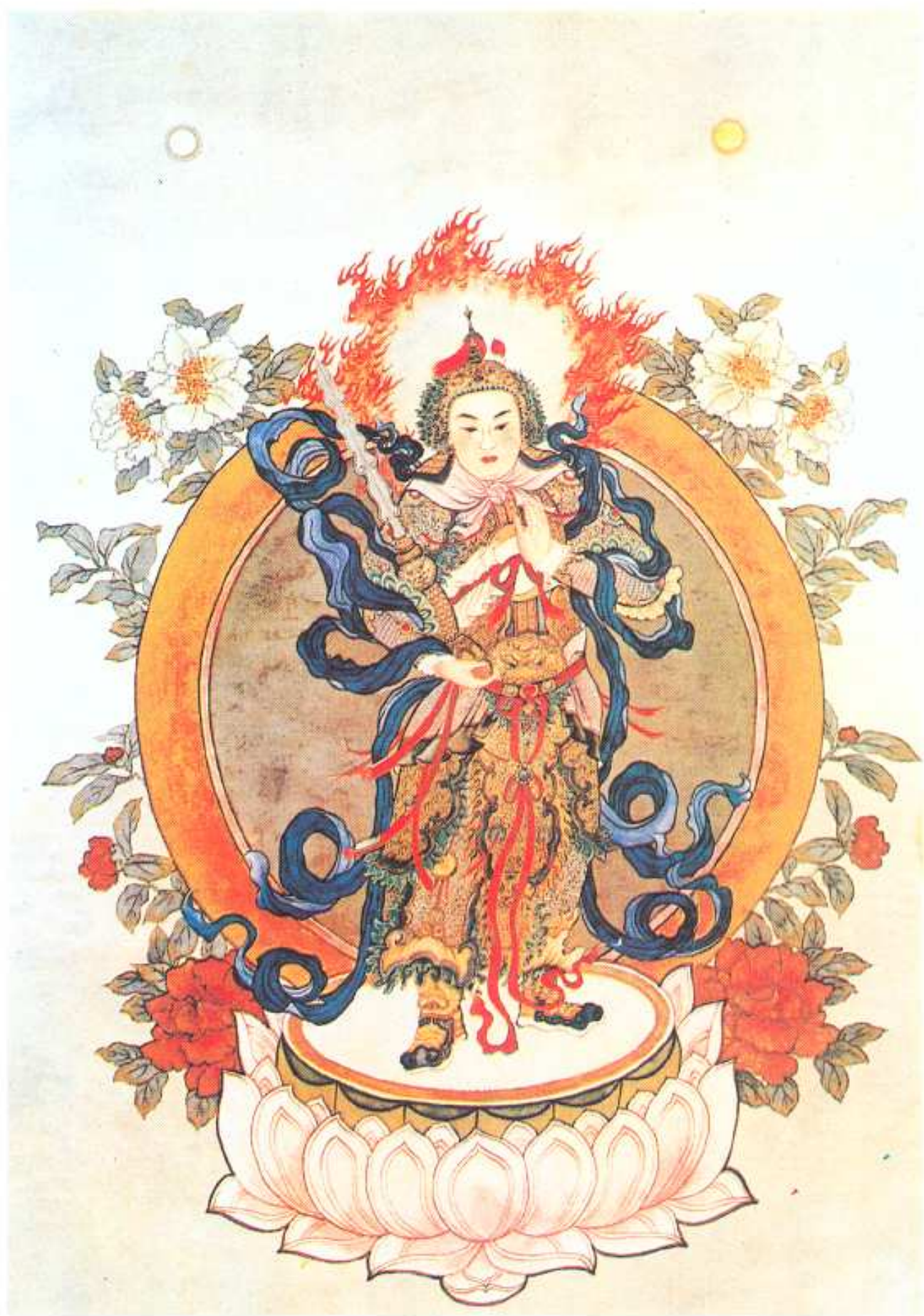
南無護法韋馱菩薩聖像