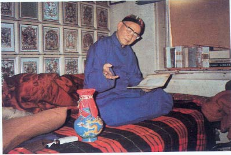
陳上師加持龍王寶瓶