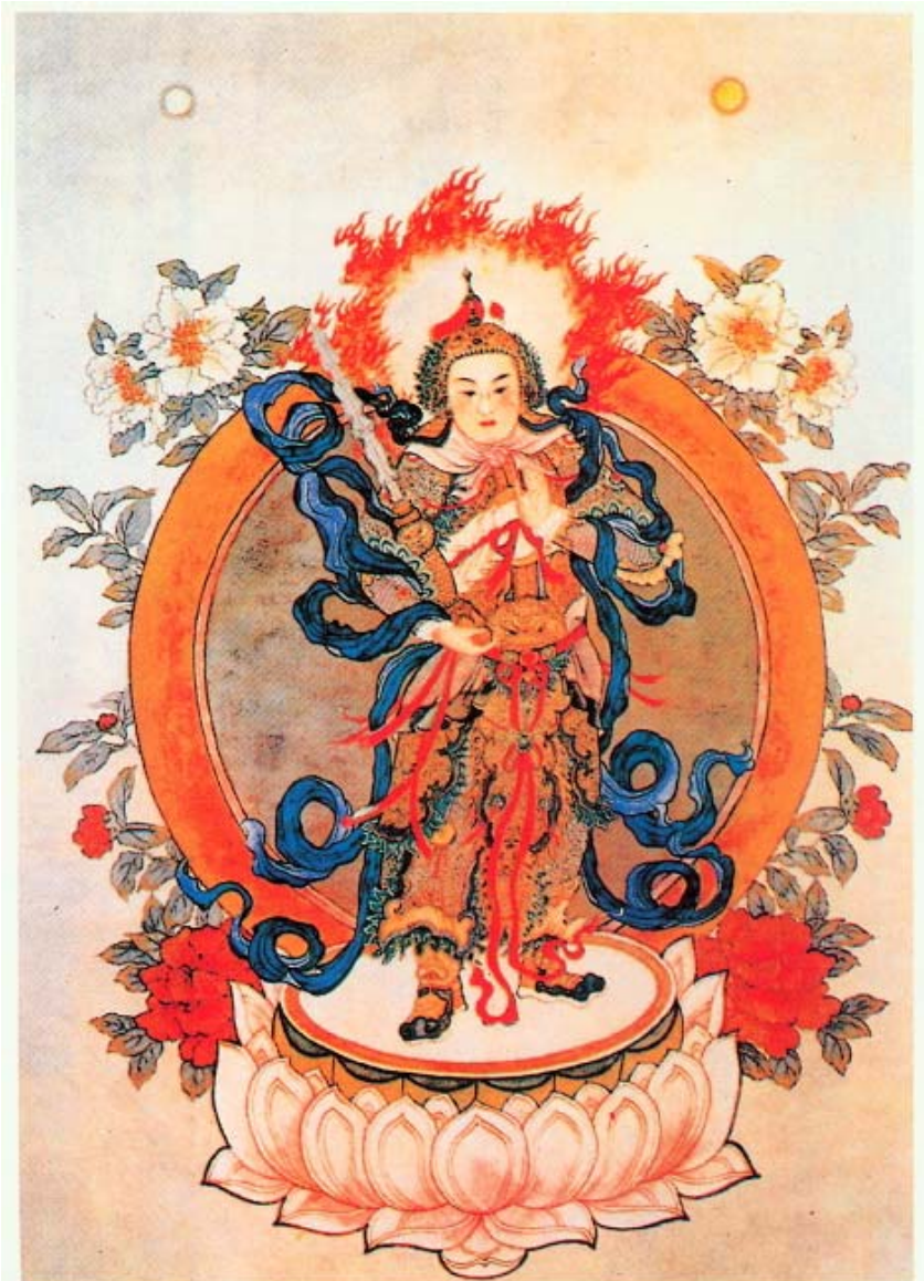
南無護法韋陀菩薩聖像