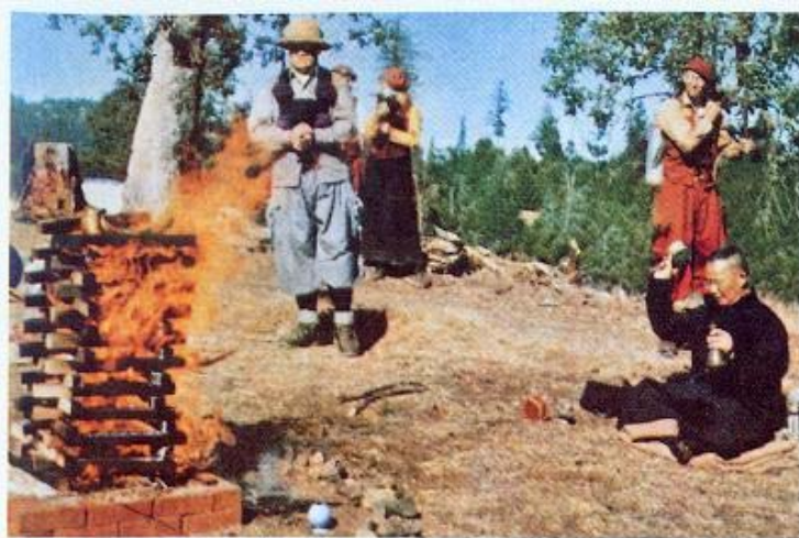
下 · 陳上師修三身頗瓦法超幽 上 · 陳上師主持火供（七十年代）