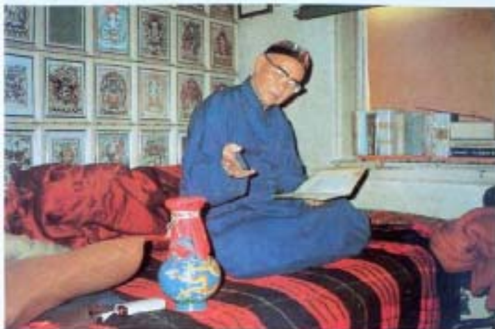
陳上師加持龍王寶瓶