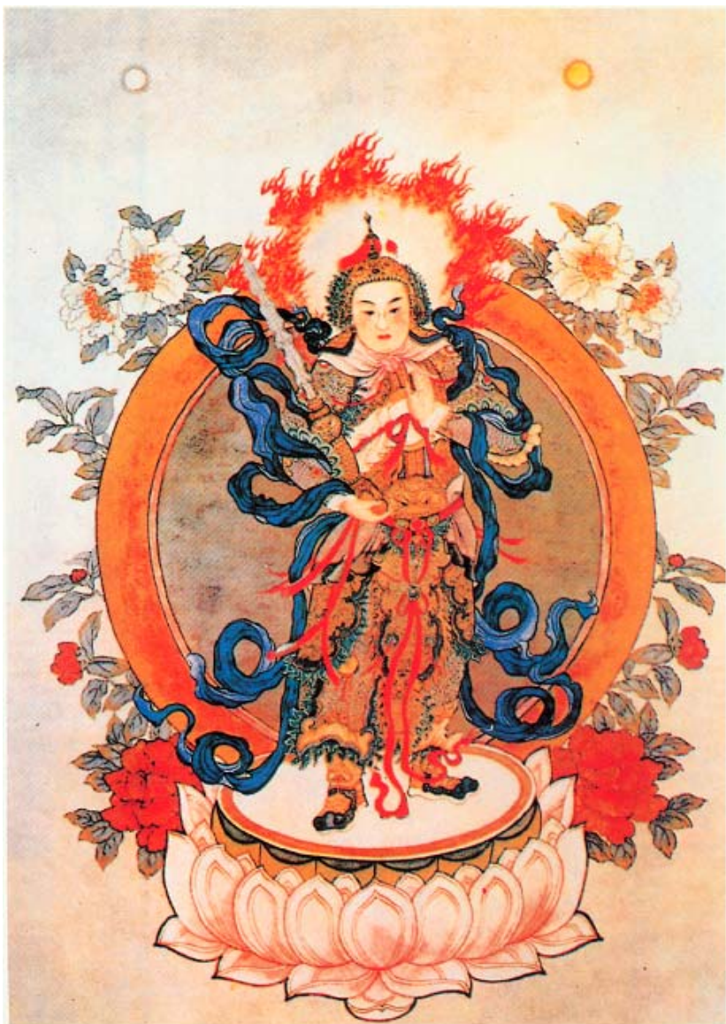
南無護法韋陀菩薩聖像