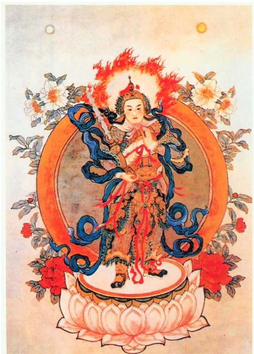
南無護法韋陀菩薩聖像