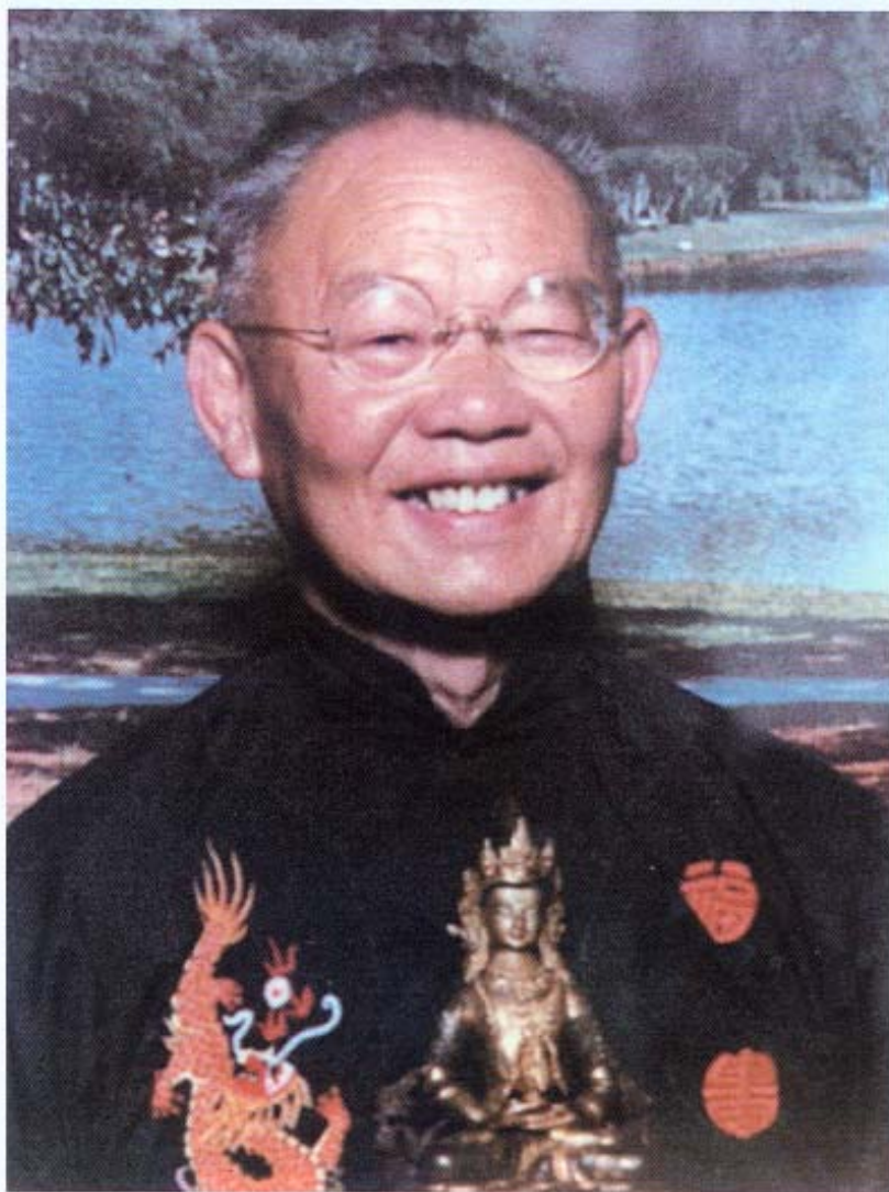
作者陳健民瑜伽士