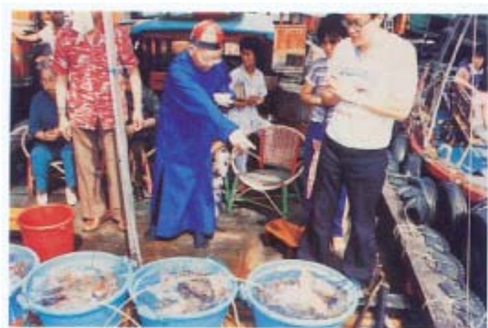
下·陳上師講經之神采